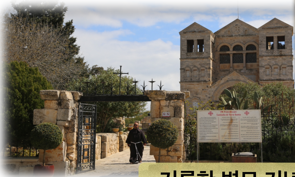
거룩한 변모 기념 성당